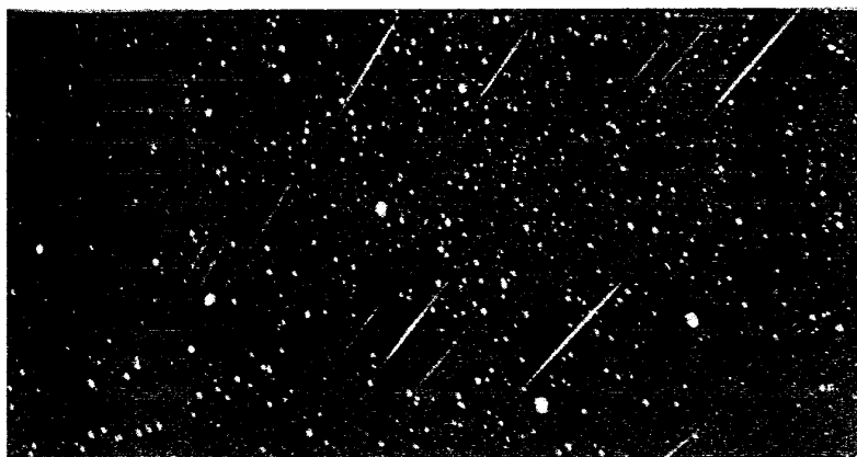
La massima pioggia di meteore che sia mai stata registrata, quella delle Leonidi sull'Arizona il 17 Novembre 1966